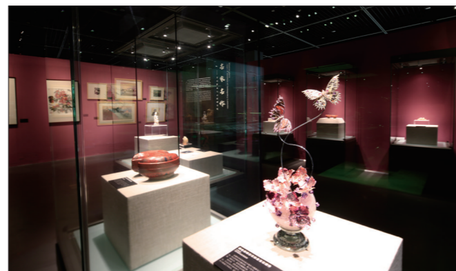
11 / 积跬步 至千里——宁波博物馆建馆十周年文物征集成果展