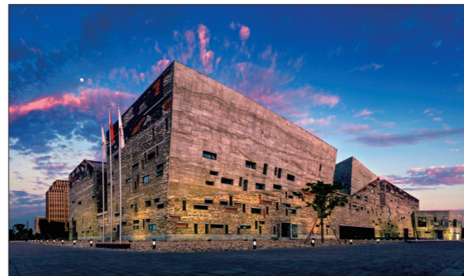
01 / 一座博物馆见证了一个城市文化发展的轨迹