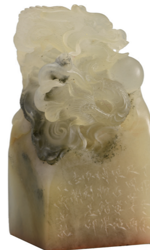
韩天衡“宁波博物馆”朱文寿山石龙钮方印

自2008年12月5日开馆以来，宁波博物馆以其独特的建筑风格与地域性的馆藏引起关注，同时也吸引着众多的中外艺术名家、收藏大家、学者等将自己的艺术代表作品、收藏精品等捐赠给博物馆，这其中不乏有著名的国际珠宝设计雕刻大师陈世英、当代著名篆刻家韩天衡、甬籍著名版画家邵克萍，以及甬籍著名学者陈炎老先生和香港甬籍著名实业家、收藏家曹其镛先生等，他们均以博大的胸襟、火热的情怀，为宁波博物馆的建设锦上添花。今后，宁波博物馆仍将以开放的胸怀，吸引更多的中外艺术家捐赠珍品，丰富馆藏。