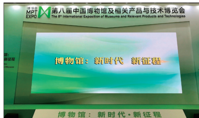
37 / 宁波博物馆文创产品亮相 2018 世博会