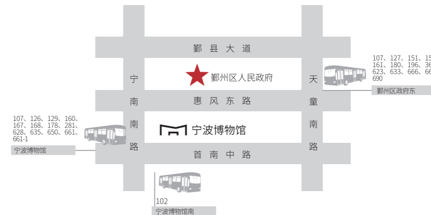
- 交通示意图 -

开放时间：9:00 至 17:00 ( 16:00 止票 ) 每周一闭馆 ( 除国家法定节假日外 ) 资讯服务：0574 82815588