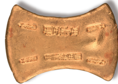
“相五郎”二十五两金锭

>南宋 >厚1.6厘米，长8.3厘米，首宽5.8厘米，腰宽3.8厘米 >2012年宁波市中级人民法院移交