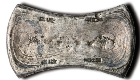
“出门税”二十五两银锭

正面刻款“相五郎”、“十分金”、“重贰拾伍两”。戳记深峻，文字清晰，为宋代金锭器型的典型代表，是研究南宋时期社会、经济、金融状况的极为珍贵的实物资料。