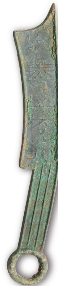
“即墨之大化”五字刀币

>战国齐 >厚0.4厘米，长18.9厘米，宽3.0厘米，环径2.7厘米 >2017年陕西文博古钱币公司征集购买