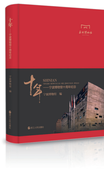
《十年——宁波博物馆开馆十周年纪念》

12月5日上午，宁波博物馆开馆十周年暨《积跬步 至千里——宁波博物馆建馆十周年文物征集成果展》的开幕式在博物馆一楼大厅举行，上海市文化和旅游局副局长、宁波博物馆原馆长褚晓波，宁波市文化广电新闻出版局党委书记、局长张爱琴，浙江省文物局博物馆与社会文物处处长杨新平、鄞州区区委常委、副区长邱启旻以及宁波市文化广电新闻出版局党委副书记、副局长、宁波博物馆首任馆长孟建耀出席开幕仪式并致词。