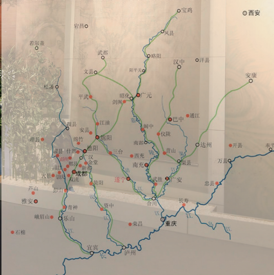
四川地区宋代窖藏分布及交通路线示意图

窖藏文化是中国的一种特殊文化类型。窖藏一般是人们在特殊情况下(如战争、自然灾害)对自己珍惜的物品的一种权宜性保存方式,因此,窖藏中出土的器物一般较精美,大多属于当时的上等产品,例如具有经济价值的钱币、带有礼制色彩的铜器等等。窖藏器物往往反映了一个时期物质文化发展的主流,如商周时期大多是青铜器窖藏,唐代多见金银器窖藏,辽宋金元则以瓷器窖藏为主。