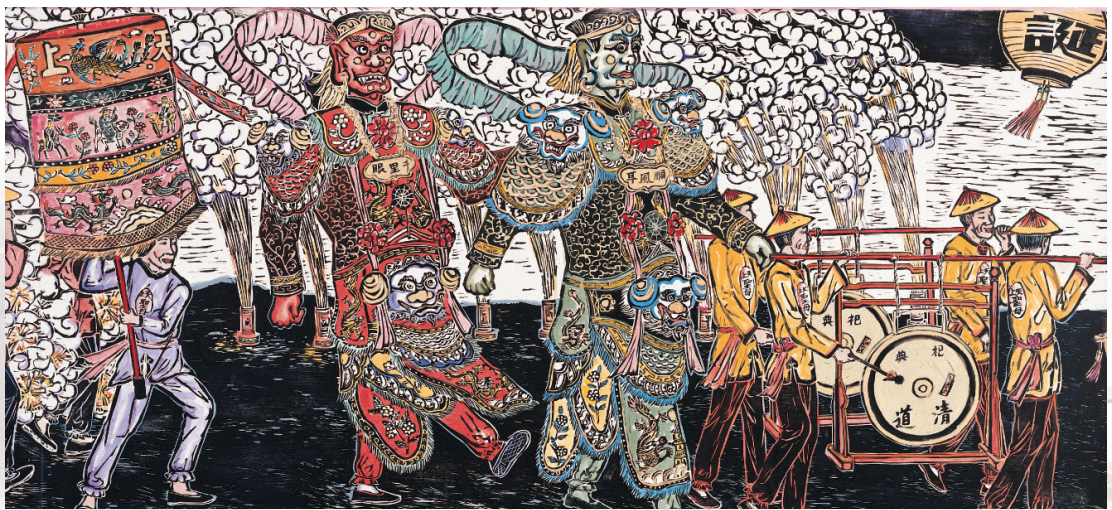
报驾大辇、千里眼与顺风耳

供花、提炉、提灯：这三种为护持妈祖而设；供花使满路遗香，以示恭维。提炉中燃沉香以净境除秽。提灯点烛，以照耀光明。