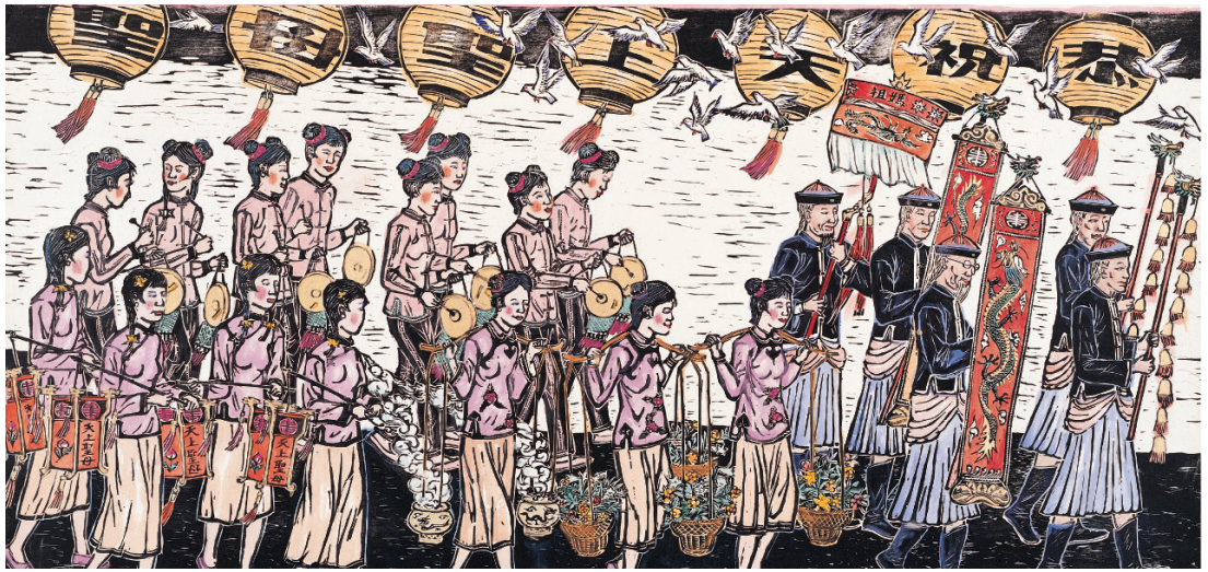
旌节、麾旛、曲柄华盖凉伞，供花、提炉、提灯、持舆辇队